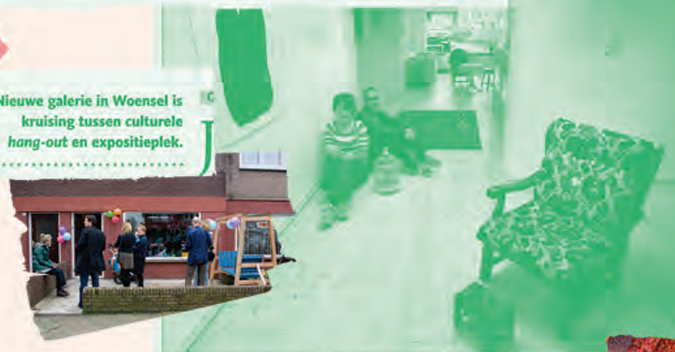
Deuren van de Markt en Tante Netty in Woensel West, nieuwe galerie in Woensel West.

Nieuwe galerie in Woensel is kruising tussen culturele hang-out en expositieplek.